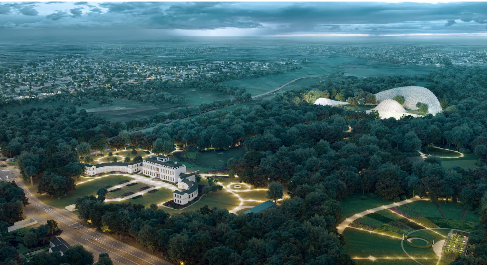
Eden Soestdijk in vogelvlucht: ensemble van paleis, tuinen en kas