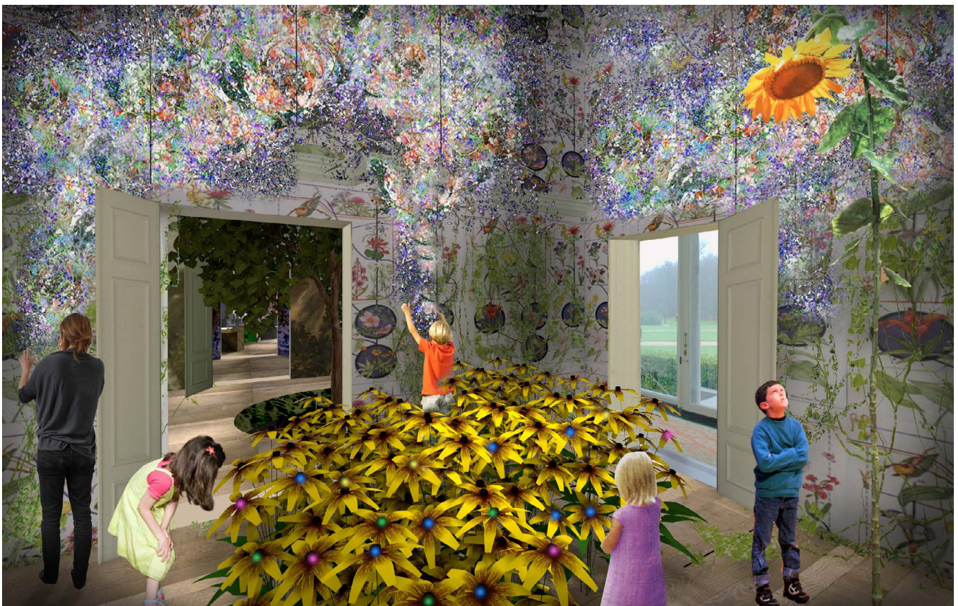
De exposities in het paleis stimuleren het denken op een fantasievolle manier

Het landschap maakt integraal onderdeel uit van Eden Soestdijk. De paleistuin wordt in oude glorie hersteld. Spannende, sprookjesachtige en educatieve tuinen en landschappen versterken de beleving van de natuur. Met elk hun eigen kenmerkende sfeer sluiten ze aan bij het centrale thema van duurzaamheid. Het voorplein van het paleis en het restaurant in de orangerie zijn openbaar toegankelijk via een fiets- en voetgangerstunnel onder de Amsterdamse Straatweg.