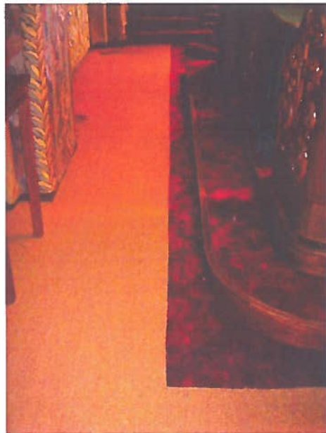
De overgang naar het sisal kan beter.