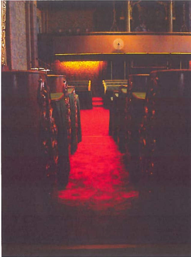
Het patroon moet doorlopen!