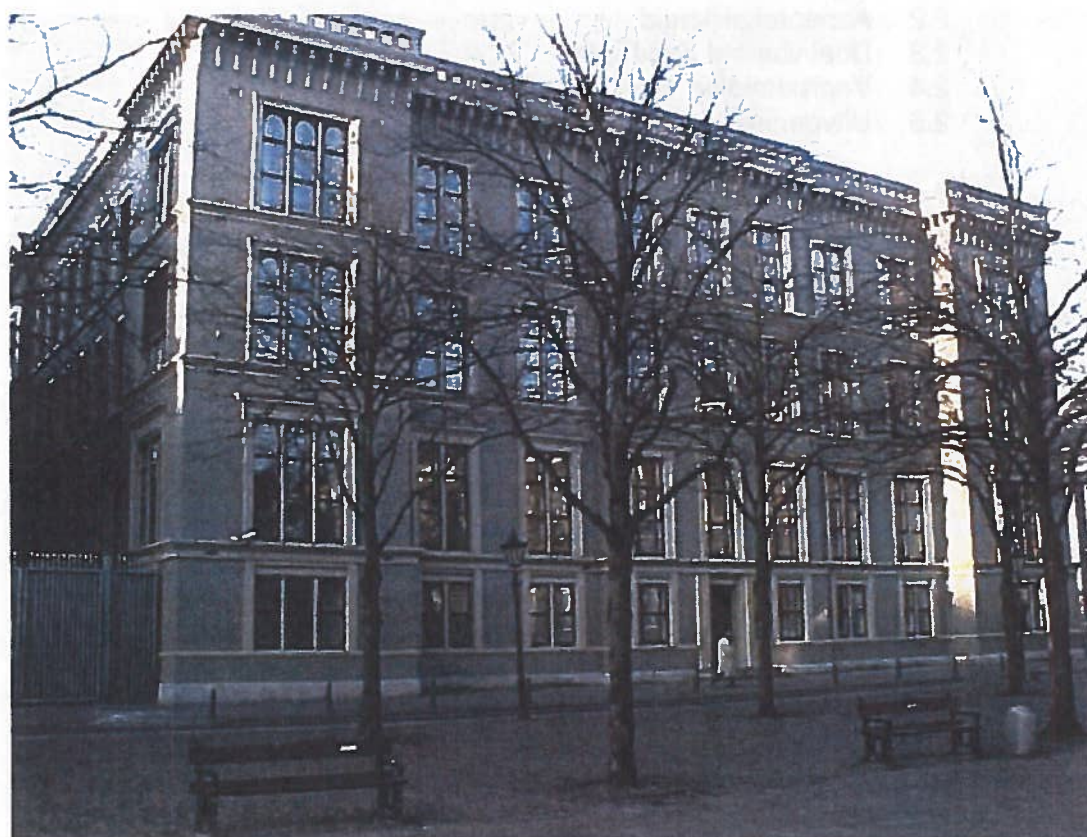
Plein 1 te Den Haag