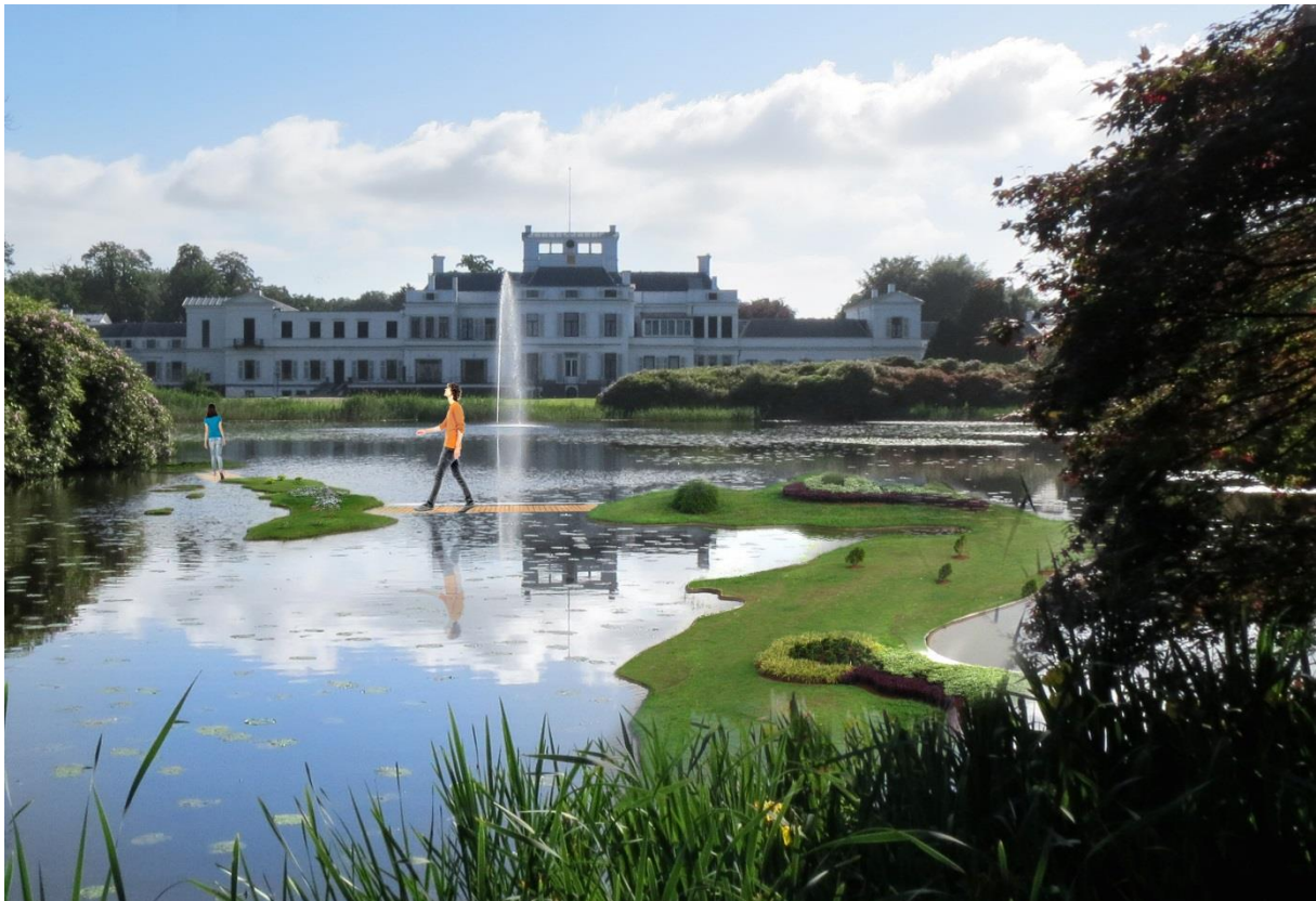
Thema Water in de 'Proeftuin': de Artifici  le Archipels in de Hofvijver

Het Paleis biedt allerlei mogelijkheden voor zakelijke activiteiten, al of niet besloten. Maar ook het publiek krijgt de ruimte om het Paleis en het Park te bekijken en van de actuele thema's te genieten. Steeds wisselende bedrijven en (kennis)instellingen manifesteren zich voor kortere of langere tijd in de Paleisvleugels. In de 'Proeftuin' vormen historische gebouwtjes als het sportpaviljoen, het speelhuisje, de watertoren, het ch  let en de ijskelder   n een aantal nieuwe tijdelijke follies visueel aantrekkelijke, interactieve onderdelen van Made By Holland .