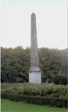
Gedenknaald Rijswijksebos 1 Rijswijk Zuid-Holland