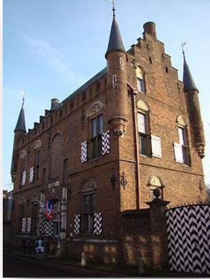
Maarten van Rossumhuis Nonnenstraat 5 Zaltbommel Gelderland