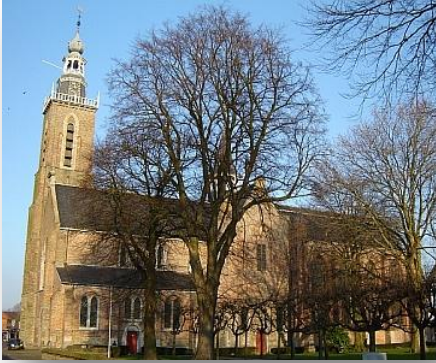
Sint Baafskerk Sint Bavostraat 5 Aardenburg Zeeland