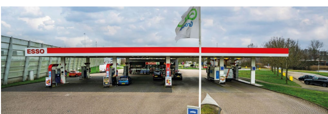
3. Locatie 'De Watering'