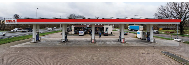
8. Locatie 'Tolnegn'