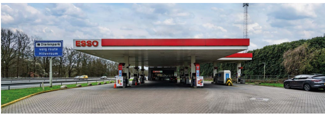
1. Locatie 'Hooglanderveen'