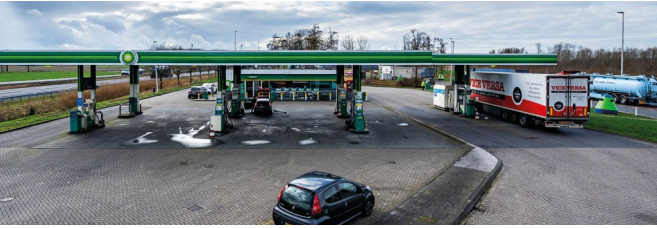
7. Locatie 'Panjerd'