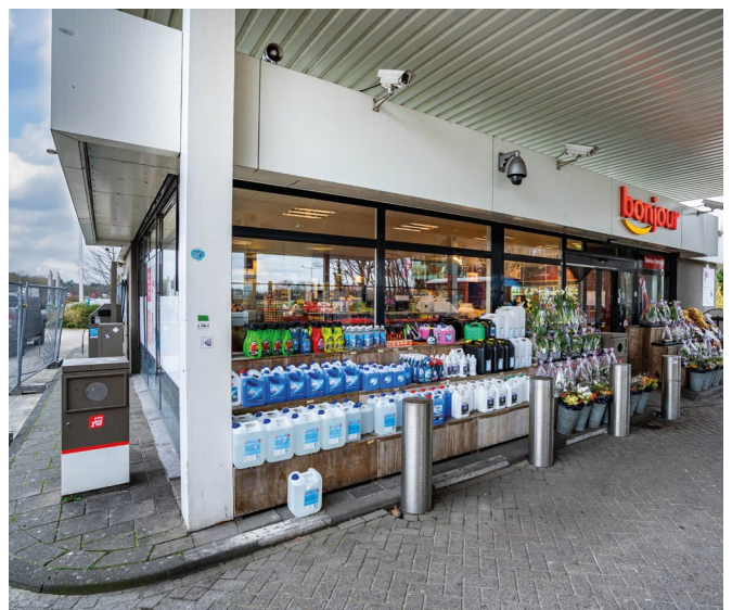
Location 'Wouwse Tol'