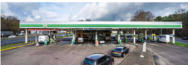
2. Locatie 'Bornheim'