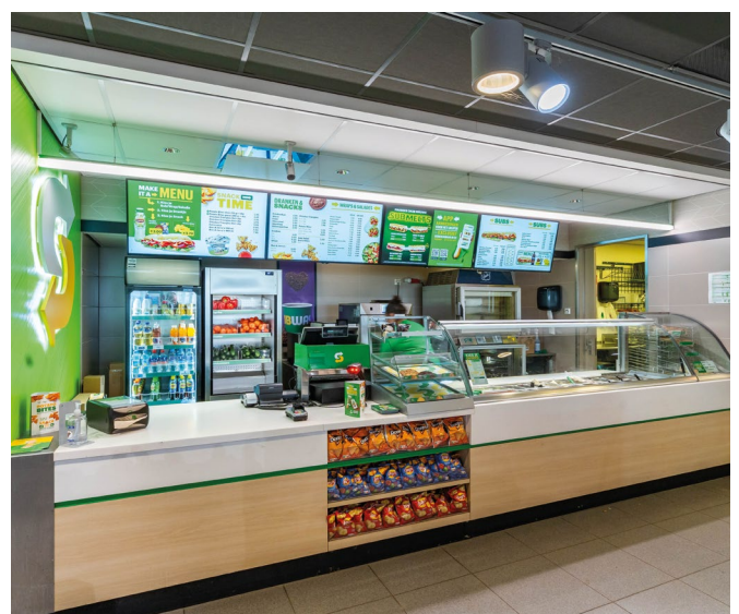
Location 'De Watering'