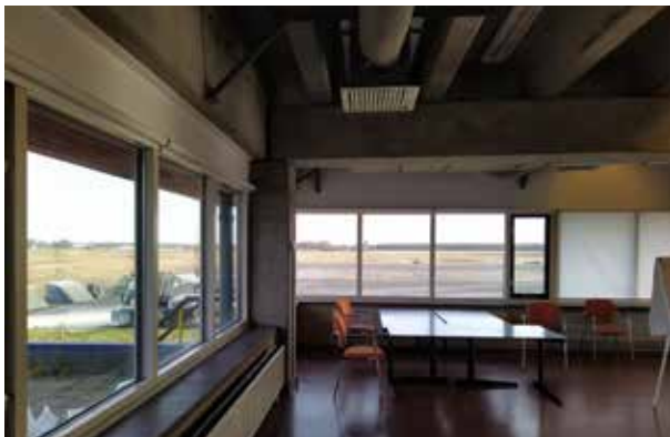
Huidige situatie: kantine