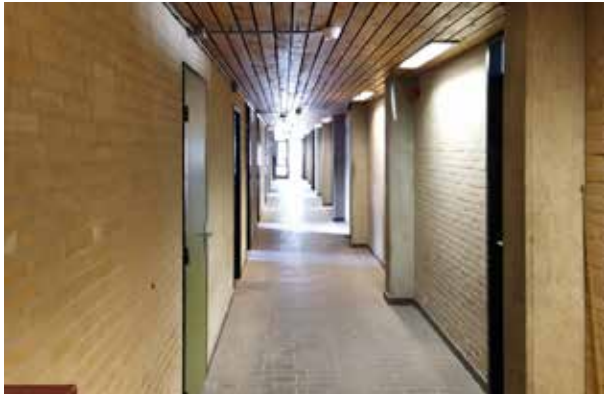
Huidige situatie: binnenzijde gang

De opgave sluit naadloos aan bij onze visie op circulair renoveren en bouwen in het gebied.