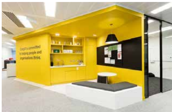
Voorbeeld van het toevoegen van ankerpunten

Het RVB zal de inschrijvers die een geldige inschrijving hebben ingediend in de inschrijvingsfase een passende tegemoetkoming in de inschrijvingskosten betalen. Bij de inschrijfdocumenten zal ook nader worden ingegaan op het eerdergenoemde taakstellende budget.