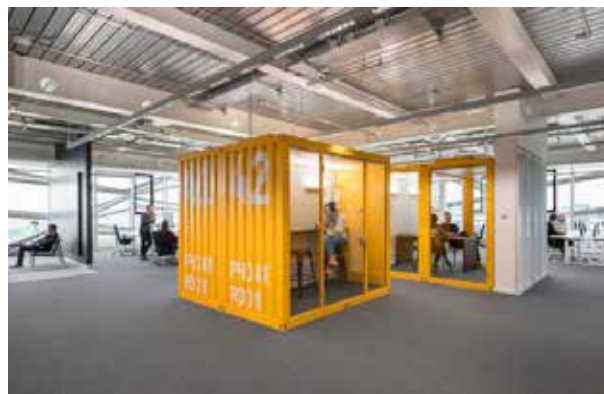
Voorbeeld van een circulaire vergaderruimte