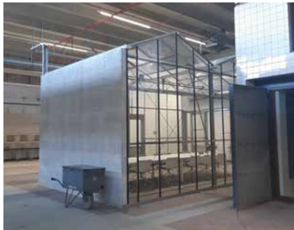
Circulaire renovatie gebouw 356