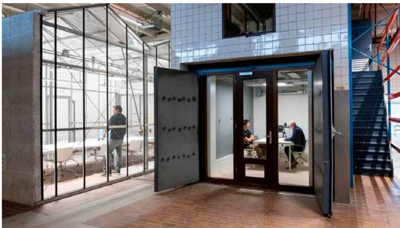
Voorbeelden van huidige circulaire vergaderruimtes in gebouw 356