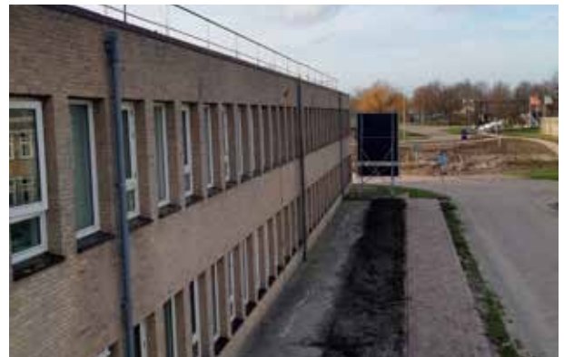
Huidige situatie: buitenzijde