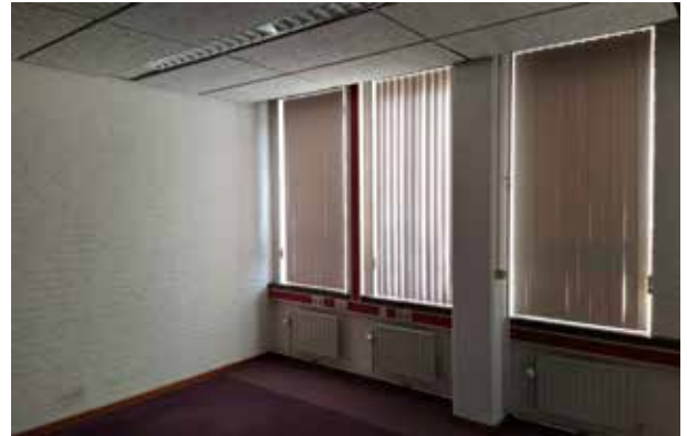
Huidige situatie: kantoorunit