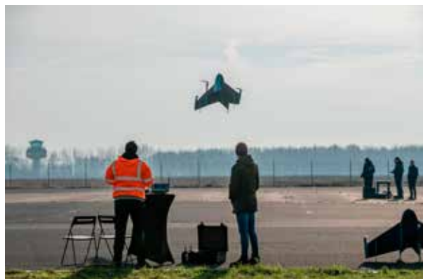
Gebruiker Valkenburg - Dronescholen