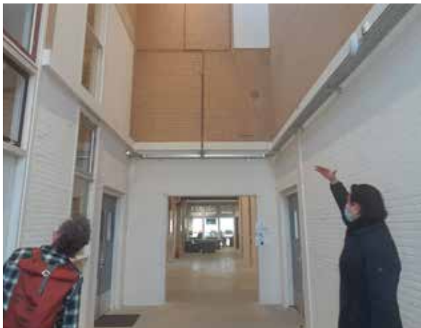
Circulaire renovatie gebouw 356

Het project “Kantoor Vol Afval” (KaVA) betreft het circulair ontwerpen en renoveren van een gedateerde kantooromgeving naar een comfortabele en aansprekende kantooromgeving conform hedendaagse normen voor de Rijksoverheid. De ontwikkeling van KaVA (fase 3) sluit aan bij fase 1 en 2 van gebouw 356 en voormalig vliegveld Valkenburg.